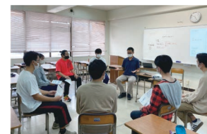
全員で円になり自己紹介