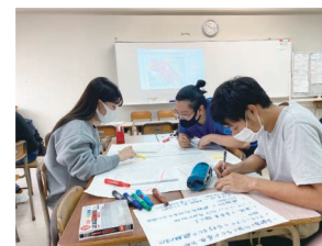
校区マップから課題と資源の確認